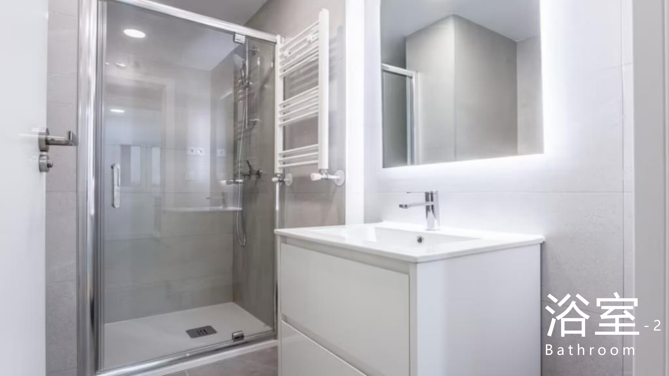
浴室 - 2 Bathroom